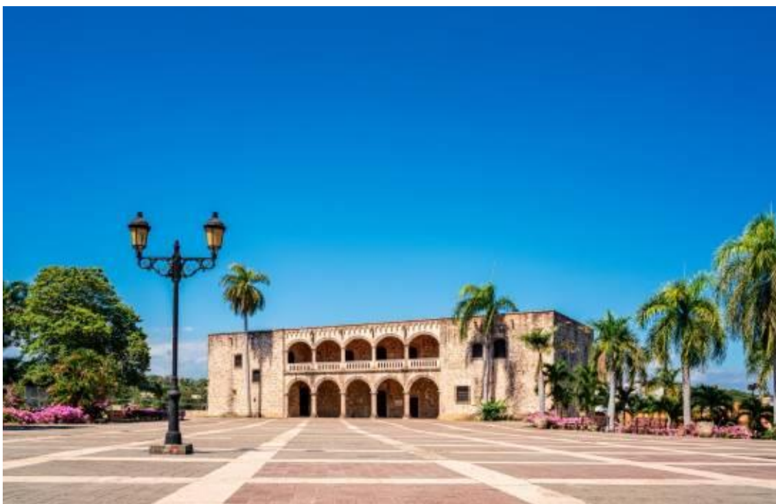
Santo Domingo, Palacio Virreinal de Diego Colón. Fachada oeste (2020). (GIOVANNI CAVALLARO)

•Extracto del escrito de Julia Vicioso, historiadora y diplomática en la Agencia de las Naciones Unidas en Roma, en el libro “El Legado Italiano en República Dominicana. Historia, Arquitectura, Economía y Sociedad”